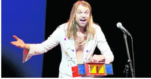
Extrem: der schwedische Comedian Carl-Einar Häckner.